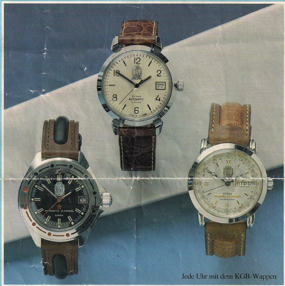
Jede Uhr mit dem KGB-Wappen