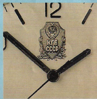
Jede Uhr trägt das bekannte Emblem des KGB.