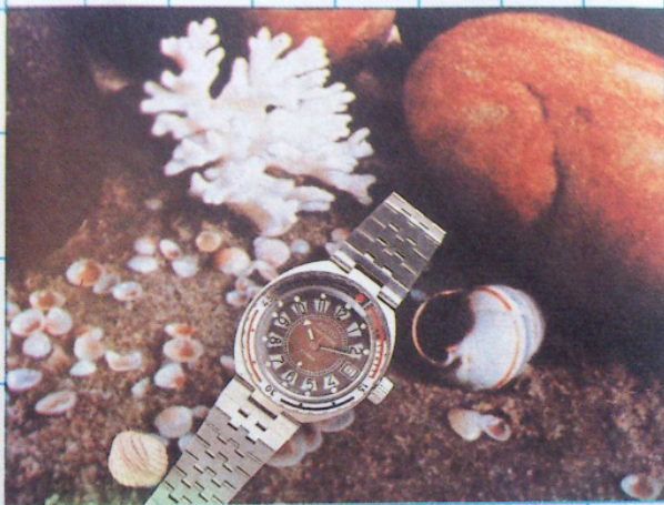
← Модель 2416Б/9370265

Циферблат радиально-штрихованный, коричневого цвета. Арабские цифры печатные, черного цвета. Площадки под цифры и остальная печать белого цвета. Пятиминутные деления покрыты светосоставом постоянного действия. Стрелки плоские, никелированные; с окном, заполненным светосоставом постоянного действия.